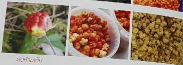
ดิบห้ามเก็บ