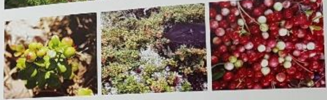
ดิบห้ามเก็บ