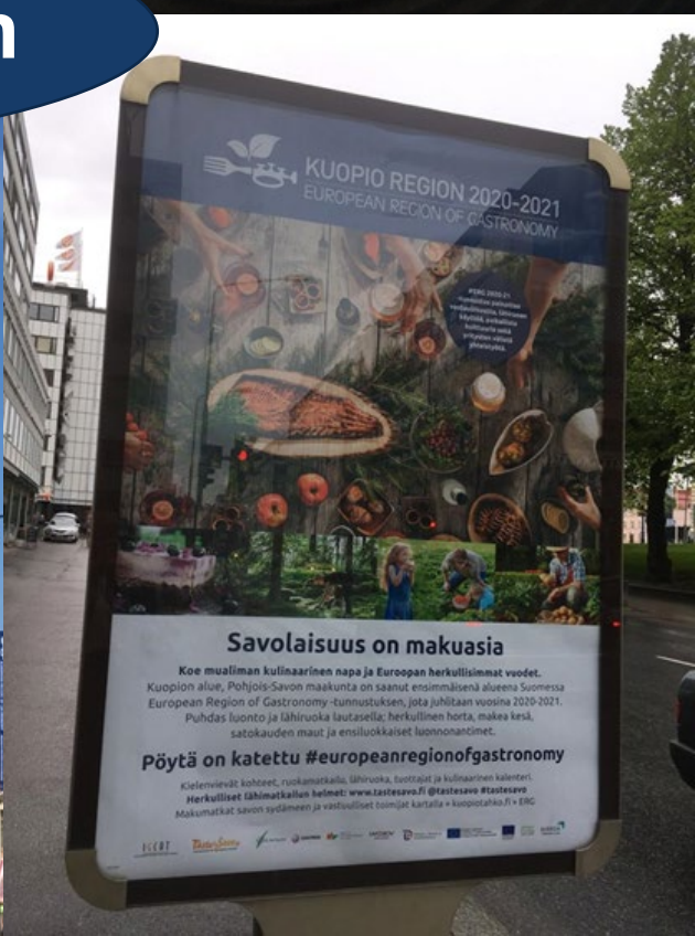
Kuvat: Puijon Peak, Ravintola Kummisetä, Taste Savo, Visit Savo