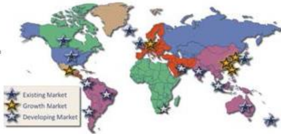
Kuva. Mustikan tuotanto maailmanlaajuisesti ja kasvumarkkinat